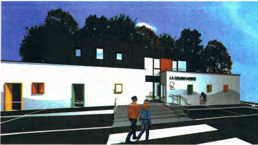
Rue du 1790 Pibeste