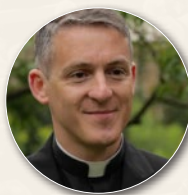
Abbé Pierre Amar