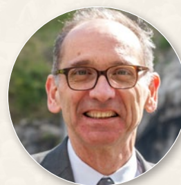
Guillaume de Vulpian