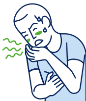
Vertiges / Nausées